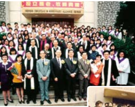
按立長老、牧師典禮 (1993年)