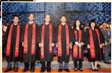
按牧典禮 (2012 年)