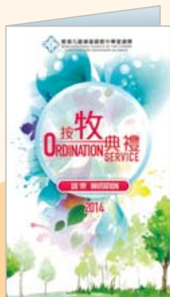
2014 年按牧典禮邀請咭