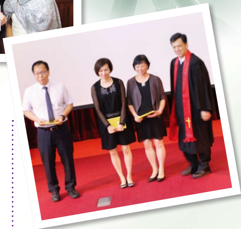
三位成績優異生獲嘉許

願主繼續使用門訓事工，成為教會的祝福，成為弟兄姊妹成長的器皿，一生跟隨主作門徒！