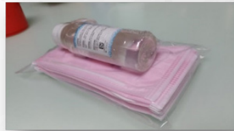
部份送出的禮物包

以往我們在節日會送上祝福禮物給長者，目前主要送防疫物資，感謝會友慷慨送出口罩，探訪隊成員專誠把防疫禮物送到有需要的長者家中，節日也用郵寄方式送上禮物包。